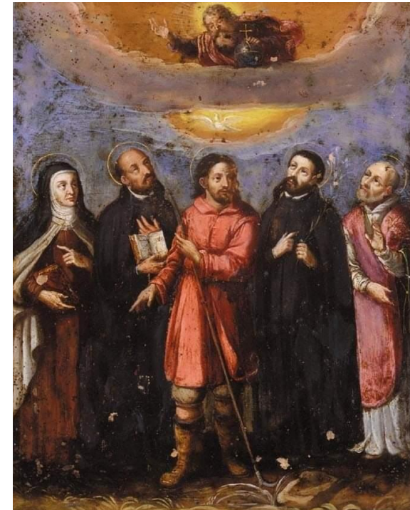
Sta. Teresa, St. Ignasi, St. Isidre, St. Francesc Xavier, St. Felip Neri Canonitzats el 12 de març de 1622: quatre espanyols i un sant!!!